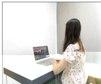
图3：侧后方第二机位效果图