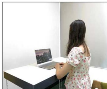
图3：侧后方第二机位效果图